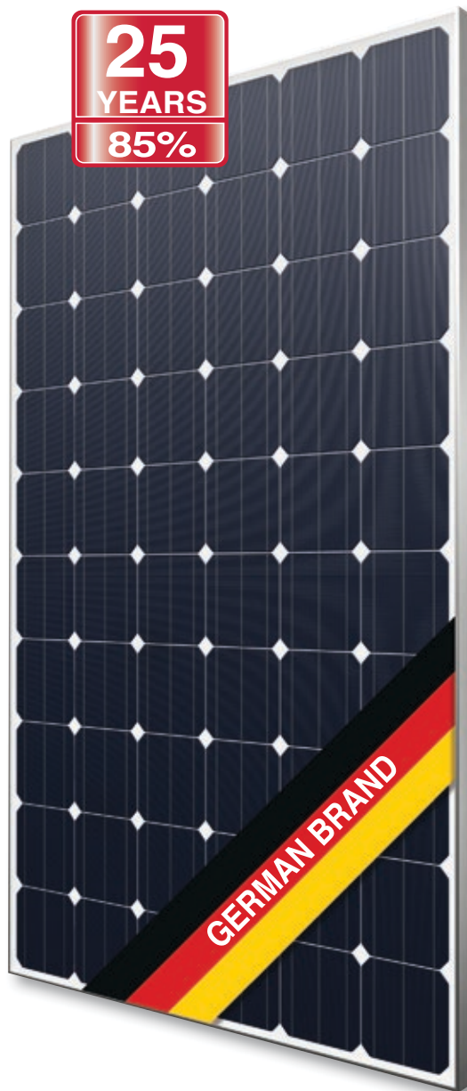
Abb. ähnlich 60M156DE151026A